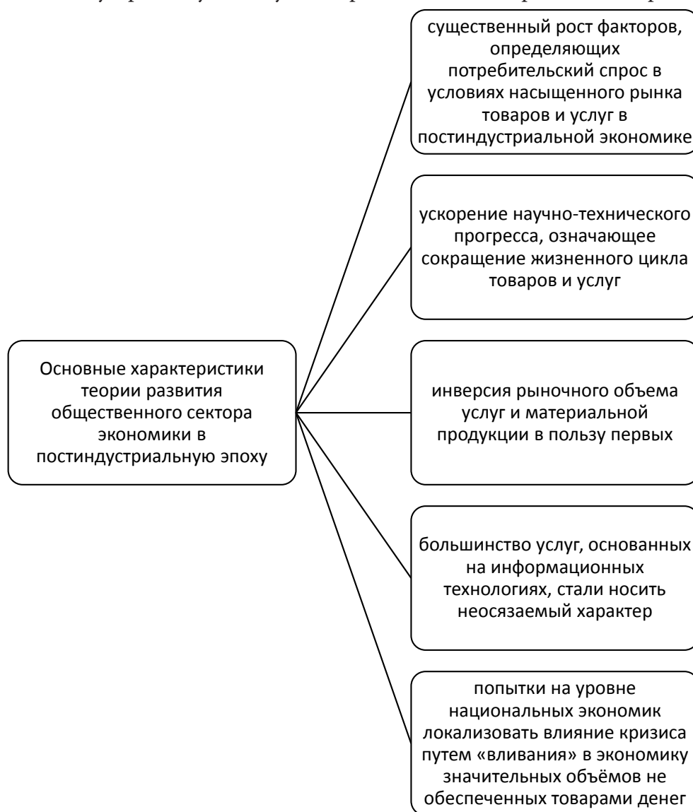
Рисунок 3 - Основные характеристики факторов, определяющих теорию развития общественного сектора экономики в постиндустриальную эпоху на современном этапе.

Основные характеристики факторов, определяющих теорию развития общественного сектора экономики в постиндустриальную эпоху на современном этапе приведены на рис.3.