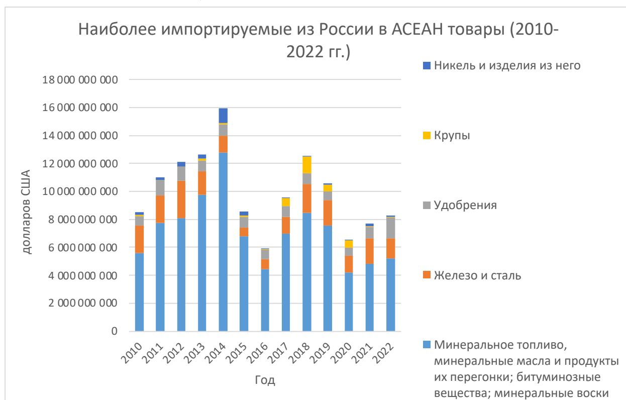
Рисунок 3 – Наиболее импортируемые из России в АСЕАН товары (2010-2022 гг.)

Текстильная промышленность АСЕАН также активно участвует в торговле с Россией, экспортируя текстиль и одежду. Помимо товарной торговли, услуги занимают весомую долю во внешнеэкономических связях, охватывая туризм, образование, IT-сервисы, а также транспорт и логистику, что способствует укреплению взаимовыгодного сотрудничества и развития экономических отношений между Россией и странами АСЕАН.