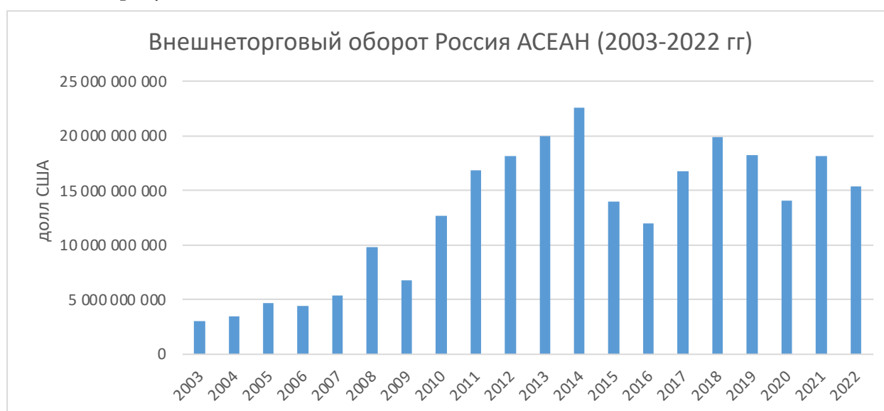
Рисунок 2 – Внешнеторговый оборот Россия АСЕАН (2003-2022 гг)

2020-е годы: Современный этап отношений характеризуется стремлением к дальнейшему расширению сотрудничества не только в традиционных сферах, но и в новых, таких, как цифровая экономика, зеленая энергетика и инновации. Пандемия COVID-19 выявила важность сотрудничества в области здравоохранения, что также стало одним из новых направлений взаимодействия между Россией и АСЕАН. Динамика торговли товарами между Россией и АСЕАН за последние 20 лет представлена на рисунке 2.