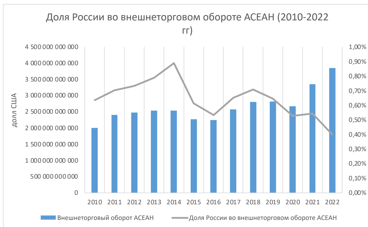
Рисунок 7 – Доля России во внешнеторговом обороте АСЕАН (2010-2022 гг)

общий внешнеторговый оборот АСЕАН демонстрирует тенденцию к росту, что отражает укрепление экономической активности и расширение торговых связей в регионе.