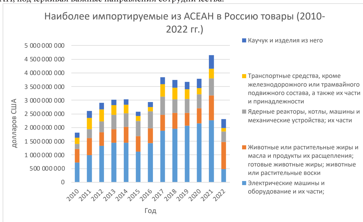
Рисунок 4 – Наиболее импортируемые из АСЕАН в Россию товары (2010-2022 гг.)

иллюстрируют многоаспектность и взаимовыгодность торговых отношений между Россией и АСЕАН, подчёркивая важные направления сотрудничества.