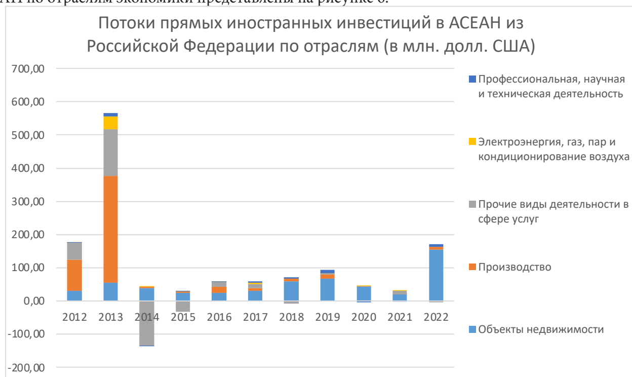
Рисунок 6 – Потоки прямых иностранных инвестиций в АСЕАН из Российской Федерации по отраслям (в млн. долл. США) (2012-2022 гг)

связей между Россией и странами АСЕАН. Данные о потоках российских инвестиций в страны АСЕАН по отраслям экономики представлены на рисунке 6.