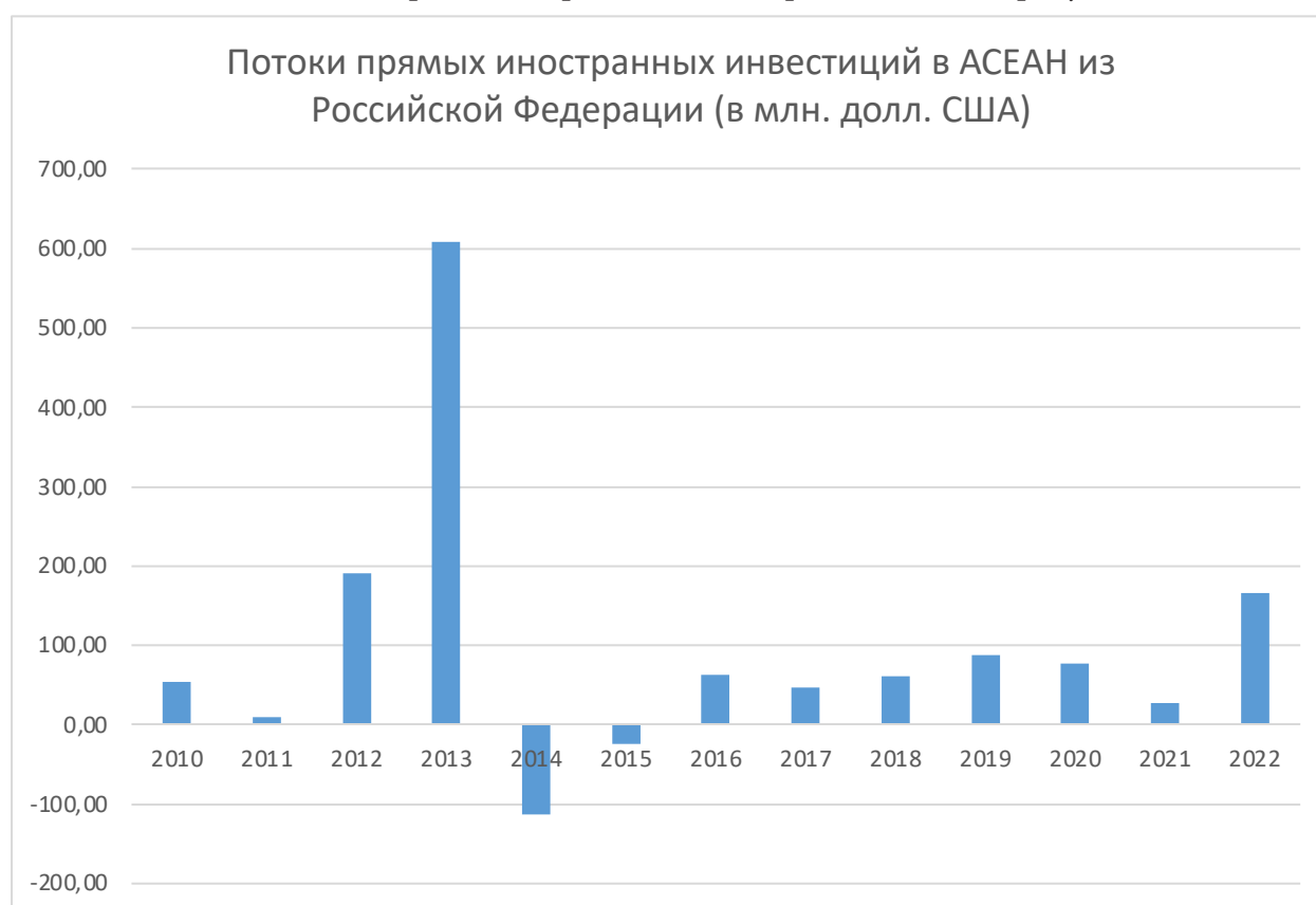
Рисунок 5 – Потоки прямых иностранных инвестиций в АСЕАН из Российской Федерации (в млн. долл. США)(2010-2022 гг)

ния стран АСЕАН к укреплению и диверсификации своих экономик в ответ на глобальные вызовы, включая те, что связаны с многополярностью мировой экономической системы и необходимостью адаптации к новым условиям. Эти аспекты делают партнерство с Россией особенно актуальным, учитывая её значительные ресурсы и технологический потенциал. Прямое отражение этого сотрудничества можно увидеть в динамике инвестиционных потоков из России в страны АСЕАН за последние годы. Колебания объемов инвестиций, особенно их рост в 2022 году, могут свидетельствовать о новом витке развития экономических отношений, который будет способствовать углублению и расширению взаимной выгоды от сотрудничества. Данные о потоках прямых инвестиций из Российской Федерации в страны АСЕАН представлены на рисунке 5.