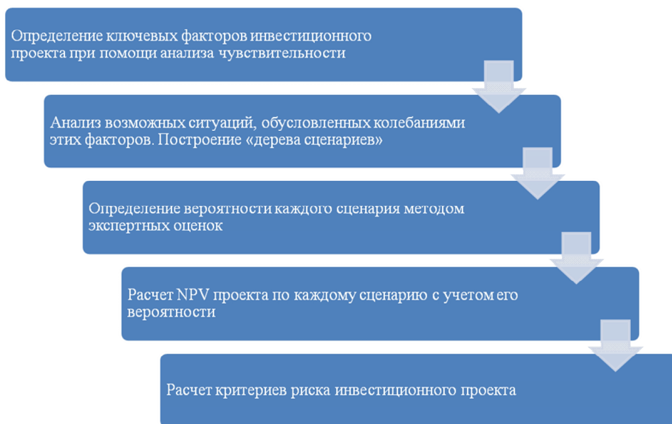
Рис. 2. Классический алгоритм сценарного анализа

Как видно из схемы, в условиях значительного колебания внешних макроэкономических параметров самое слабое место в данном алгоритме – это этап определения вероятности каждого сценария методом экспертных оценок. С одной стороны, в условиях турбулентной и нестабильной окружающей среды возрастает роль методов экспертных оценок как инструментов экономического прогнозирования развития предприятия, но, с другой стороны, в долгосрочном периоде достоверность прогнозирования значительно снижается [5]. Быстрые темпы изменений не позволяют с высокой точностью прогнозировать будущее и даже опытные эксперты затрудняются производить оценку вероятностей того или иного сценария.