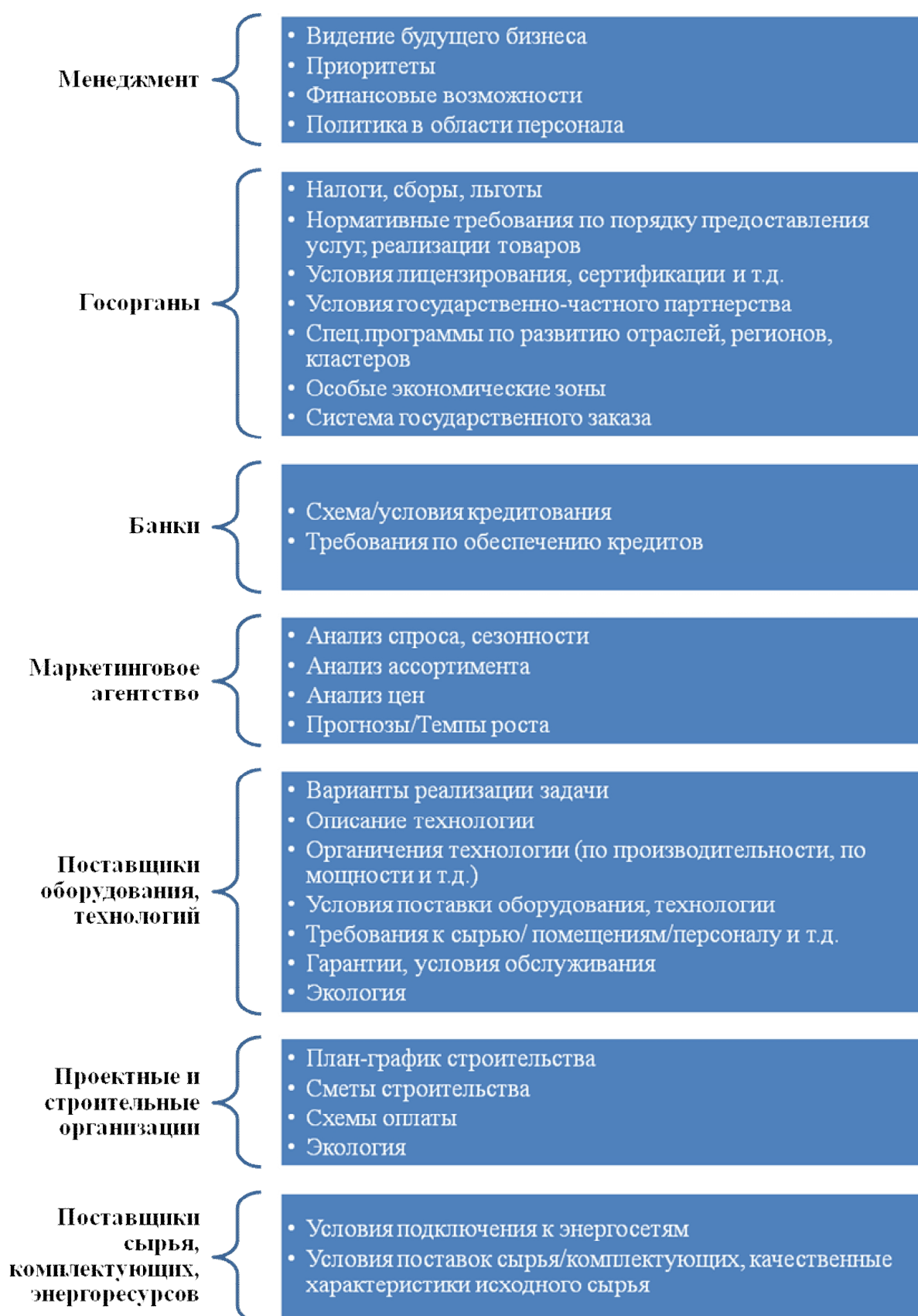
Рис. 1. Информационное наполнение финансовой модели основными участниками