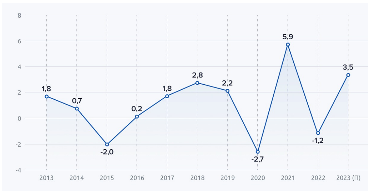
Рисунок 2 – Динамика темпов роста ВВП в России за период 2013-2023 гг.

Источник: составлено авторами на основе данных https://data.worldbank.org